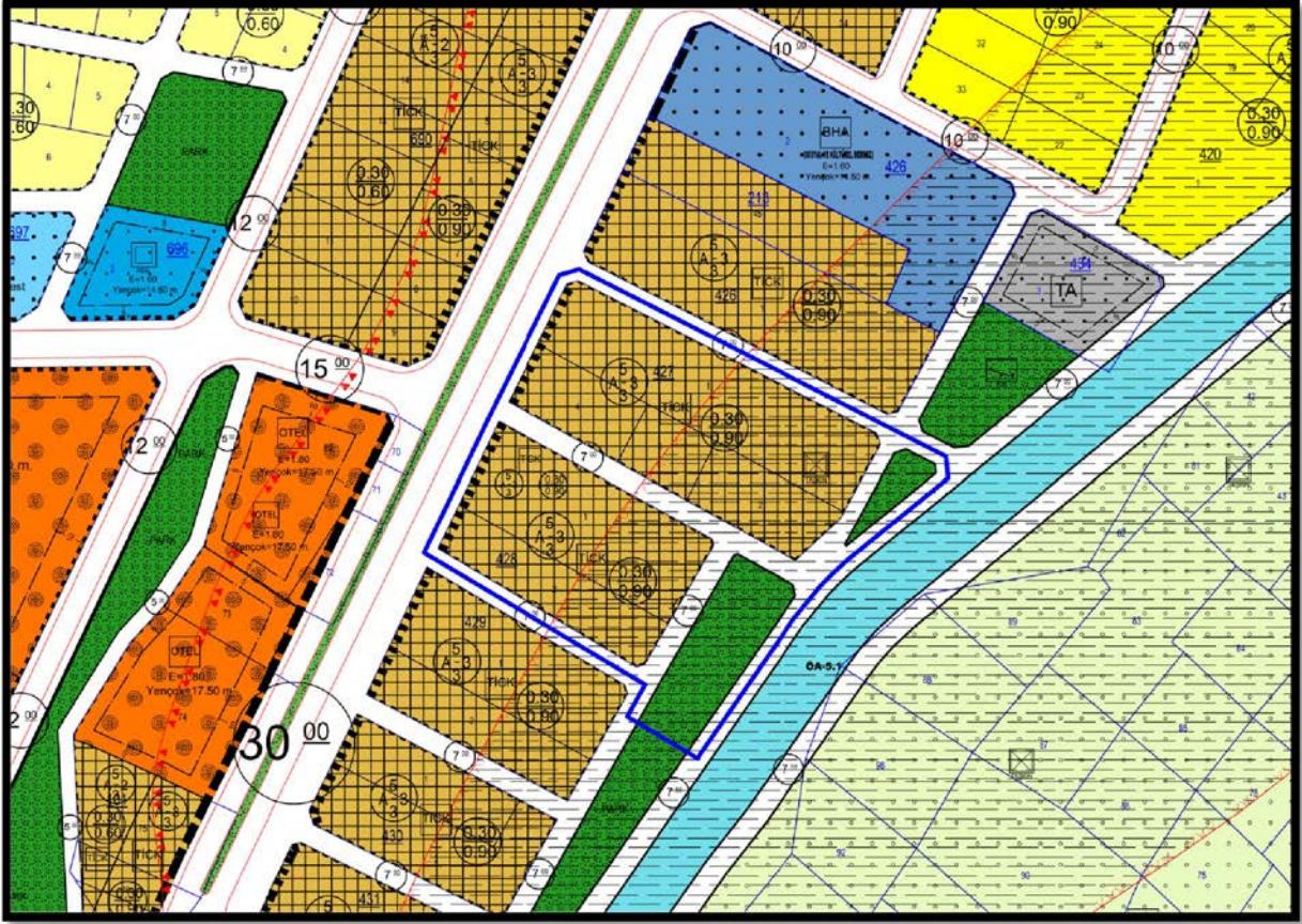
Onaylı 1/1.000 Ölçekli Uygulama İmar Planı