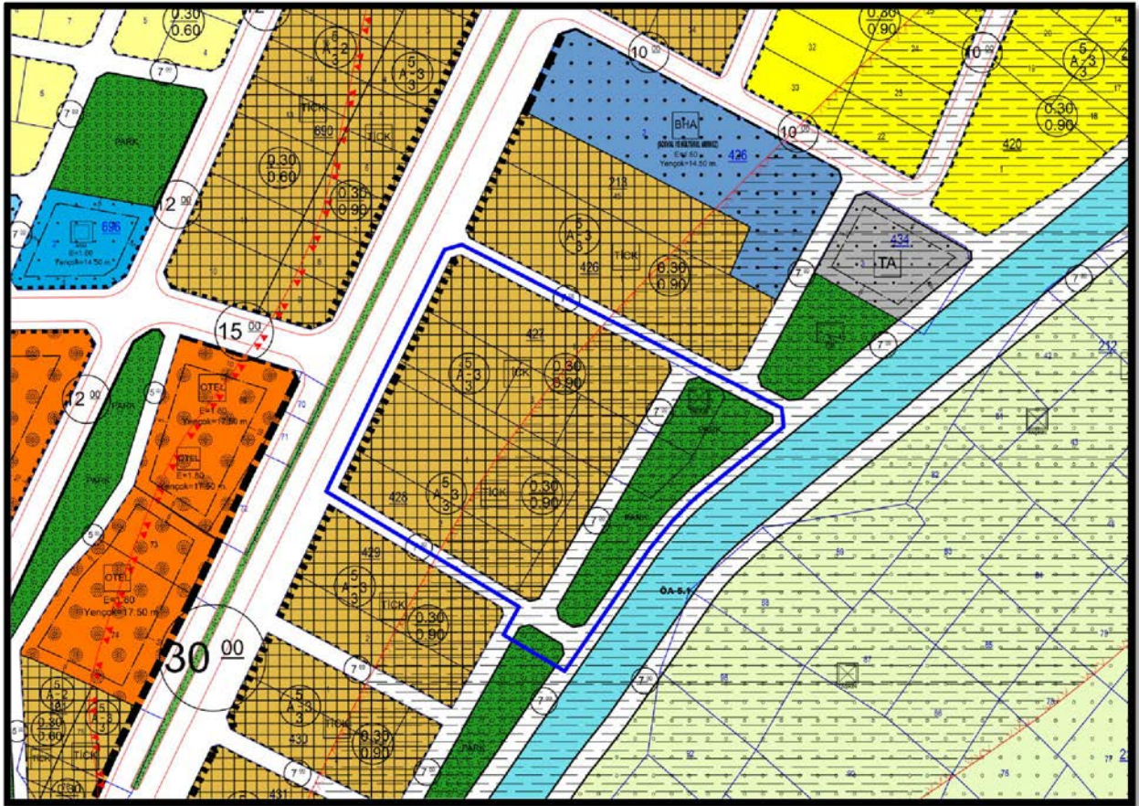
Öneri 1/1.000 Ölçekli Uygulama İmar Planı