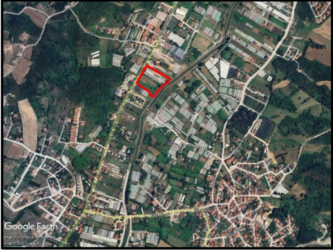
İmar Planı Hazırlanan Alanın Uydu Görüntüsü

İmar planı değişikliği hazırlanan parseller Kadıköy Belde Merkezinin 800 metre kuzeybatısında yer almakta olup Yalova-Termal Karayoluna cepheli durumdadır. Bölge içerisinde imar uygulamaları tamamlanmış olup Konut Alanı ve Ticaret+Konut Alanı olarak yapılaşmalar ön plana çıkmaktadır.